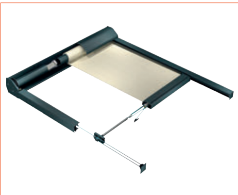
Sistema de tensión mediante muelles