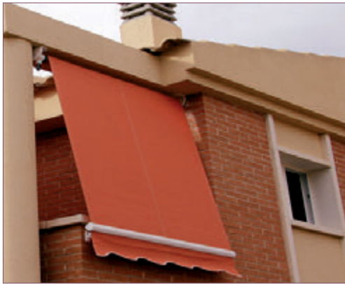
Sistema fijación modo Telón