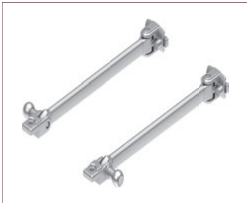
Brazos en aluminio con tensión de 500mm