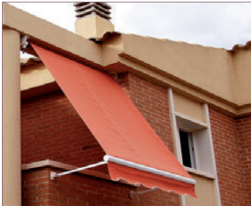
Sistema fijación modo Toldo