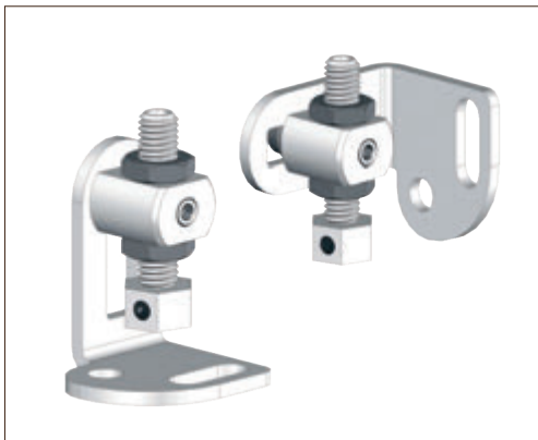
Soporte fijación pared/suelo