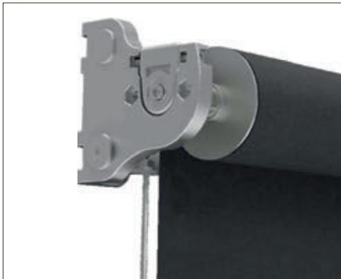
Guiado mediante cables de 3mm