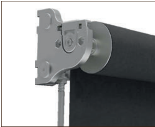
Guiado mediante varillas de 10mm