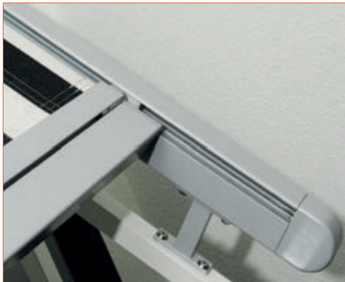
Système de guide avec pistons.