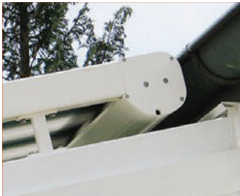
Coffre pour la protection de la toile.