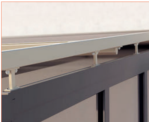
Différents supports de fixation de guides.