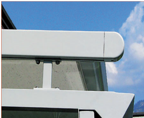
Système de guide avec pistons.