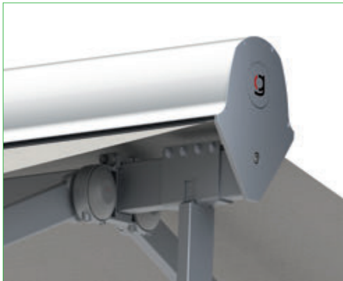
Structure en aluminium