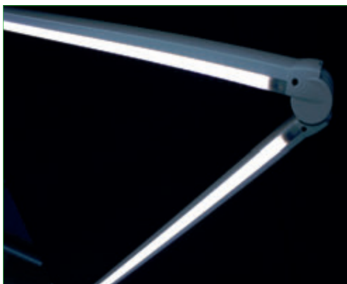
Différents types de base