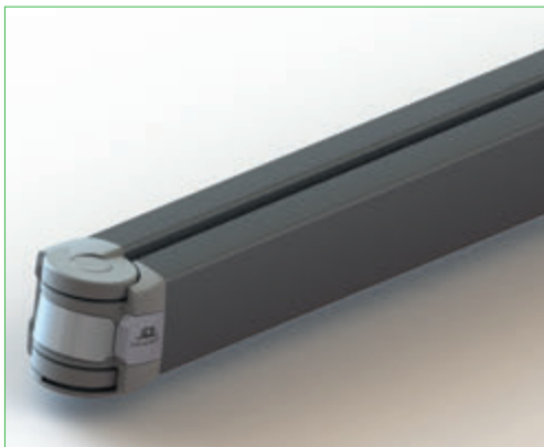
Installation de stores Coffre 5036